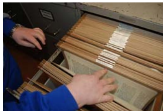
Framtagning på gång.

Vår tjänst med uppdragsforskning har fortsatt att fungera, även om det varit på en lägre nivå än vad vi förväntat oss. Vi har dock utfört ett antal uppdrag varav några fortsätter in på det nya året. Beträffande det ekonomiska utfallet av uppdragsforskningen så hänvisar vi till resultatrapporten.